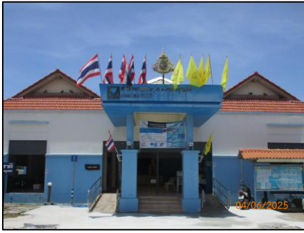
อาคารศูนย์ชุมชน