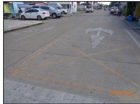
สภาพถนนภายในโครงการ