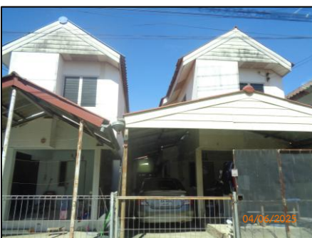
บ้านเดี่ยว 2 ชั้น