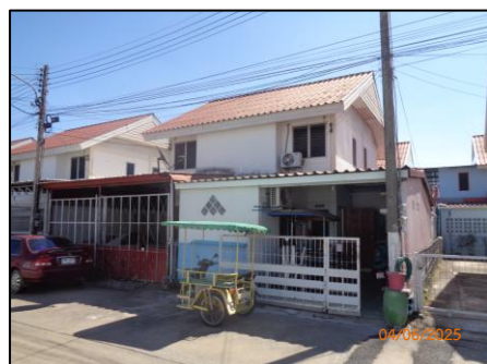
บ้านแฝด 2 ชั้น