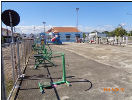
สนามเด็กเล่น